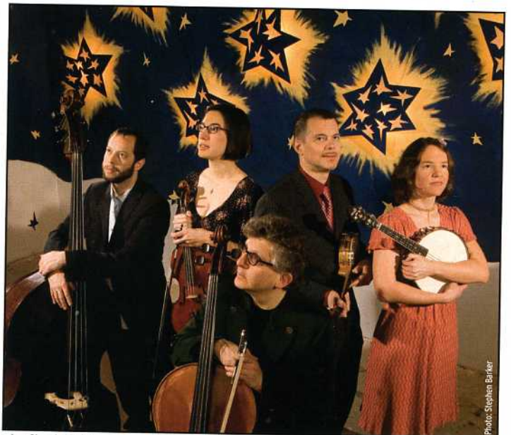
Les Chauds Lapins